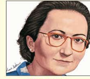
16. Maria Nicotra (1913-2007) Catane, democristiana

Costituente-Madre della Repubblica. Affronta il rischio della lotta clandestina, assistendo i partigiani. Aiutarli voleva dire guardare in faccia il pericolo di essere catturata, interrogata, processata. Nel '43 rappresenta il Partito Socialista nei Gruppi di difesa della donna. E' tra le fondatrici dell'Unione Donne Italiane insieme a Rina Picolato, Laura Bianchini e Ada Gobetti. Generosamente, lei che non ebbe figli, nella Commissione dei 75 che lavorava al testo costituzionale, si occupò delle garanzie economiche per le famiglie. Per la Merlin lo Stato aveva il dovere di garantire a tutti i cittadini il minimo necessario per l'esistenza dignitosa. Fu sempre attenta anche ai disastri ecologici, come l'alluvione nelle sue terre del Polesine. Fece conoscere in Parlamento e fuori la condizione delle prostitute che lavoravano nelle case chiuse, mostrando quanto fossero ipocriti tutti quelli che al governo e fuori, condannavano le prostitute per immoralità e poi le frequentavano. Potere: Modello di una politica concreta. Legalità: Impegno per uno Stato veramente democratico. Violenza: Le persiane chiuse simbolo della schiavitù femminile.