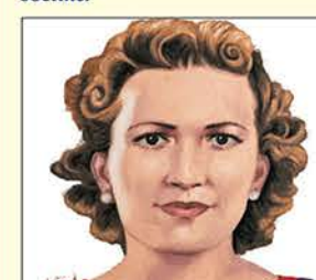
18. Ottavia Penna (1907-1986) Catane, Fronte dell'Uomo Qualunque

15 Rita Montagnana (1895-1979), torinese, comunista. Costituente-Madre della Repubblica. Inizia a lavorare in fabbrica appena quattordicenne, da apprendista sarta. Nel '21 aderisce al neonato Partito Comunista, inviata come delegata all'Internazionale Comunista e al ritorno in Italia, incaricata di dirigere il giornale comunista «Compagna». Nella Resistenza, come Teresa Noce, diventa un'attivista, cioè una militante comunista che trasporta materiale politico sovversivo. Nel '24 sposa Palmiro Togliatti; dopo la Liberazione assume incarichi nel Partito e dirigente dell'Unione Donne Italiane. Consolida esperienze internazionali. Nel dopoguerra, è favorevole alla nazionalizzazione delle banche e alla riforma agraria, favorisce negli stabilimenti piemontesi le sale materne e gli asili nido. Emarginata progressivamente dalla vita di partito, dopo la fine del matrimonio con Togliatti, si ritira con il figlio Aldo a Torino. Potere: L'assiduità della lotta quotidiana. Violenza: La negazione dei diritti. Legalità: Il rispetto dei diritti internazionali.